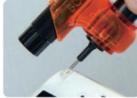
ひび割れて危険な スマホのガラスフィルムに