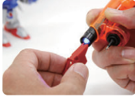
プラモデルのパーツ修理や 成型に