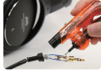
ヘッドフォンプラグの 断線修理に