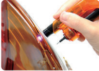
バイクや車の 破損したランプカバーを修復